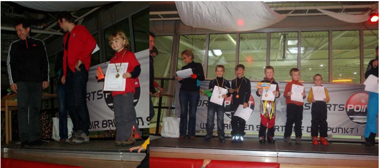
Einsame Siegerin in der U6 w und Sieger und Platzierte in der U8 m