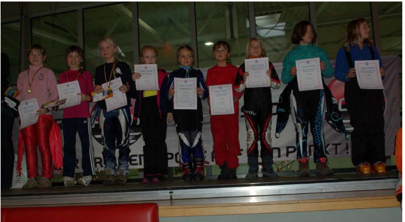
Platzierte im großen Starterfeld der U10 w