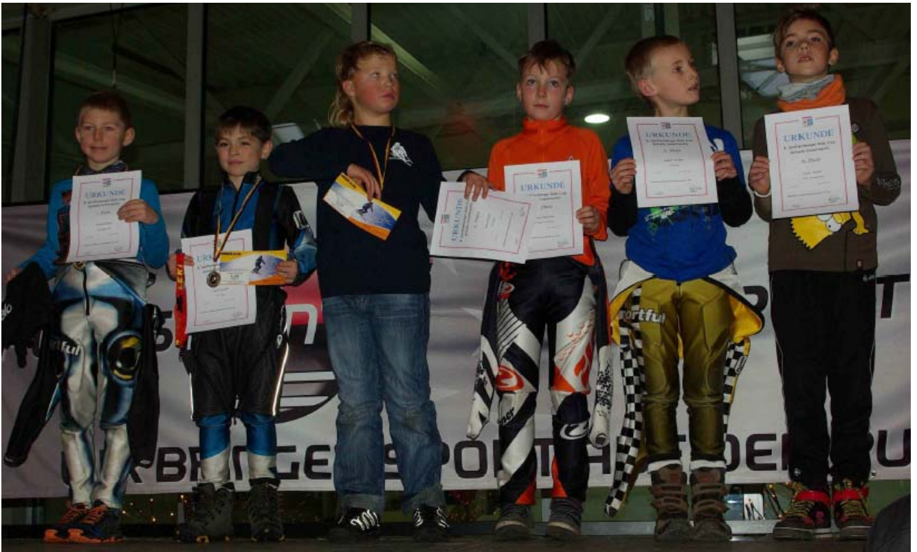
Glücklicher Sieger in der U10 m